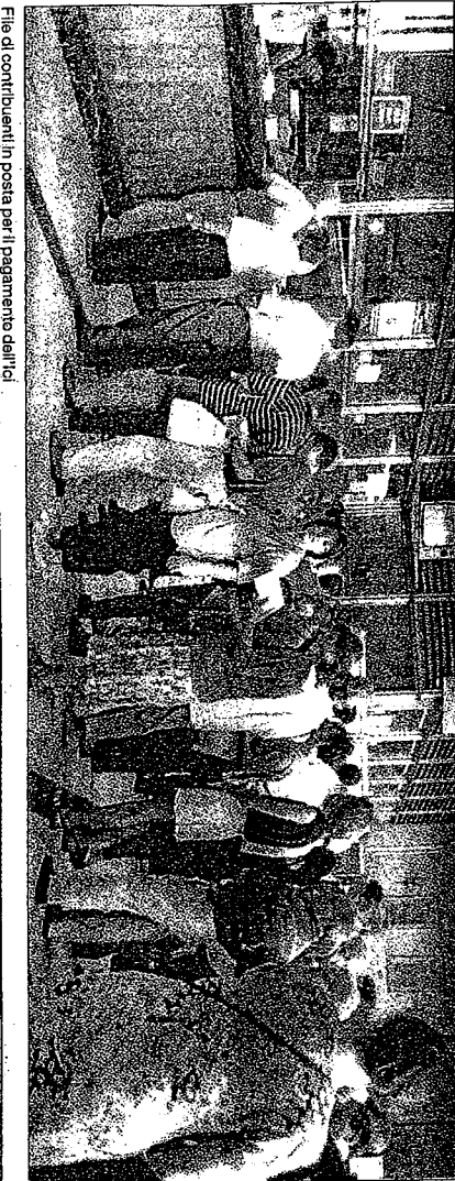
Fila di contribuenti in posta per il pagamento dell'Ici

Quasi tutti i proprietari di bar e caffè denunciano 7000 euro, i gioiellieri 6000